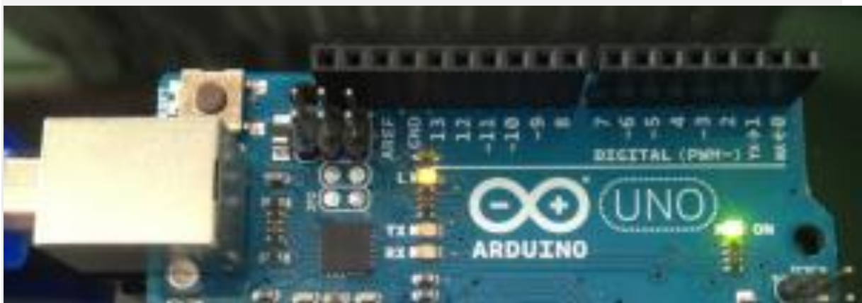
pines del 0 al 13

Arduino dispone de 14 pines que pueden ser usados de este modo, numerados del 0 al 13: